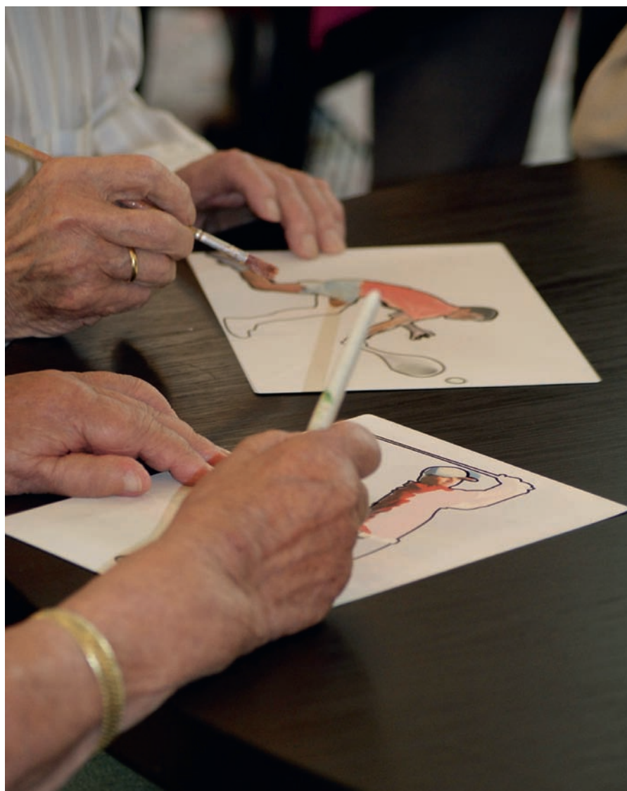
Als je met een natte kwast over het papier gaat komt er een prachtige afbeelding tevoorschijn.