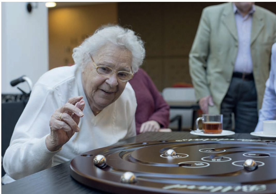
De initiatiefnemers van SpelPlus bezochten activiteitenbegeleiders in zorgcentra. Zij probeerden de spellen uit en gaven feedback.